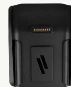
S1F2 Ladestation (kompatibel mit Schutzhülle)