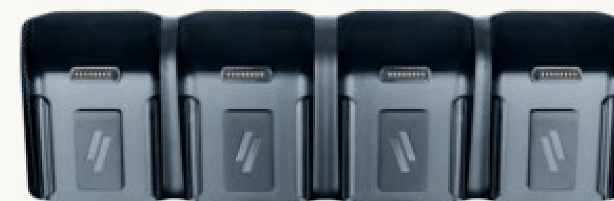
S1F2 Ladestation mit 4 Steckplätzen