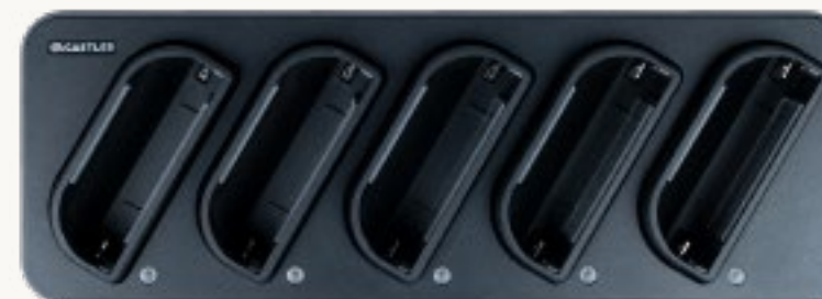
S1F2 Ladestation mit 5 Steckplätzen