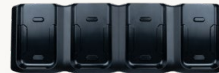
Ladestation mit 4 Steckplätzen