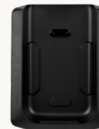
Ladestation (kompatibel mit Schutzhülle)